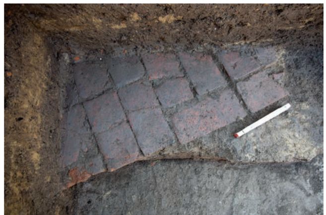
Fig. 5. Popești. Detaliu al construcției medievale târzii cu pavaj de cărămizi și podea de lut galben nisipos (în aria Cavoului lui Dumitru Cristea).