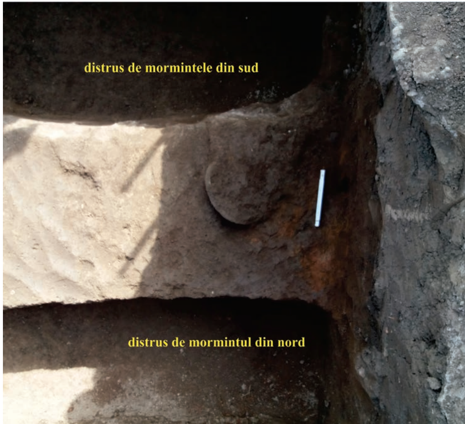
Fig. 3. Popești. Fund de chiup găsit in situ în strat de arsură din Latène-ul mijlociu (în aria Cavoului familiilor Popa și Vasile).