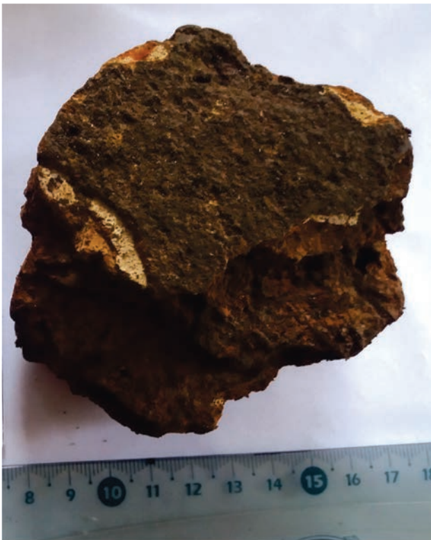
Fig. 4. Popești. Fragment de chirpic gros, ars, cu straturi succesive de zugrăveală albă, din strat Latène mijlociu.