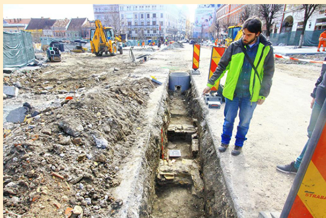
Săpături de salvare în centrul istoric al orașului Cluj-Napoca

Rolul și impactul pozitiv al arheologiei publice în străinătate sunt dovedite tocmai prin valorificarea patrimoniului arheologic și nominalizarea siturilor arheologice de pe limesul britanic și german pe lista UNESCO. În aceste țări arheologia publică reprezintă deja o metodă și disciplină prin care publicul larg și comunitatea arheologilor au reușit să lucreze împreună cu succes la valorificarea patrimoniului arheologic. ■