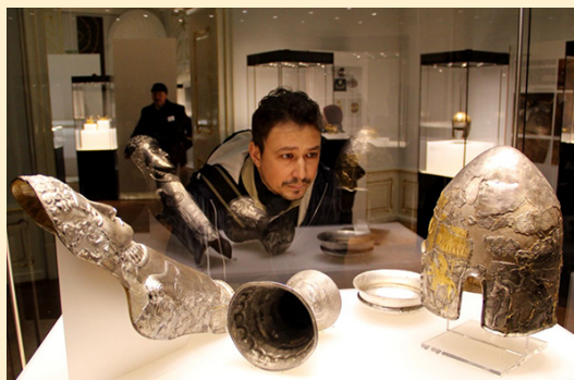
Imagini din expoziția itinerantă „Aurul și argintul antic al României” (stânga) și din expoziția virtuală organizată de Muzeul Național de Istorie a Transilvaniei, Cluj-Napoca

P edagogia arheologică presupune muzeologia modernă, andragogia muzeală (programe speciale pentru adulți) și activități instituționalizate prin care publicul larg intră în contact direct și interactiv cu materialul arheologic, fie că vorbim de muzee din situri arheologice sau colecții tradiționale. Pedagogia arheologică presupune și publicarea cataloagelor muzeale sau a diferitelor materiale pedagogice. Deși muzeele de arheologie