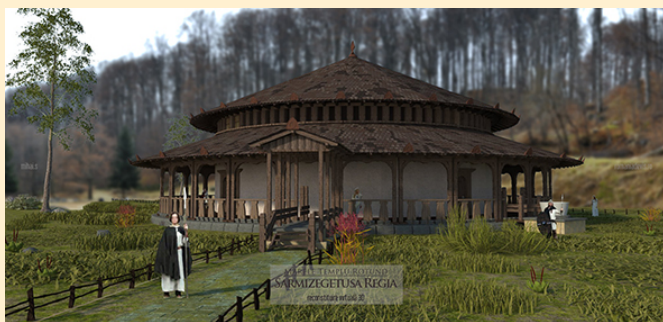
Reconstrucția virtuală a marelui sanctuar circular de la Sarmizegetusa Regia

impactul acestor exerciții și experiențe fiind mult mai mare decât metodele tradiționale de educație arheologică (manuale școlare, academice). În România, tradiția taberelor de arheologie există de mult timp, fiind