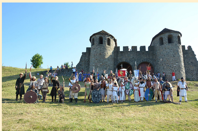
Festivalul roman Porolissum Fest 2016

din România se confruntă cu probleme grave de un deceniu (expoziții permanente închise, clădiri în restaurare), inițiative recente arată o tendință pozitivă și în acest aspect. Expozițiile temporare organizate de Muzeul Național de Istorie a Transilvaniei, care prezintă patrimoniul arheologic din Sarmizegetusa Regia și cetățile dacice din Hațeg sau de la Ulpia Traiana Sarmizegetusa în 3D, sunt doar câteva exemple bune și demne de urmat. La fel, expoziția itinerantă „Aurul și argintul României” are un impact social extraordinar: atrage sute de mii de vizitatori, nu numai prin materialul exclusiv folosit în cadrul expoziției, dar și prin modul elegant și informativ al panourilor și materialelor auxiliare. Programul „Limes” și valorificarea siturilor arheologice militare ale provinciei romane Dacia reprezintă o șansă extraordinară și probabil unică în România, pentru a crea muzee in situ sau metode interactive de pedagogie arheologică.